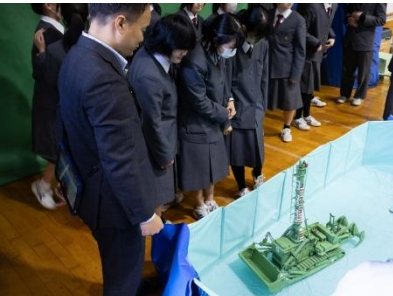
水陸両用ブルドーザ 無線操縦模型 操作(水中)