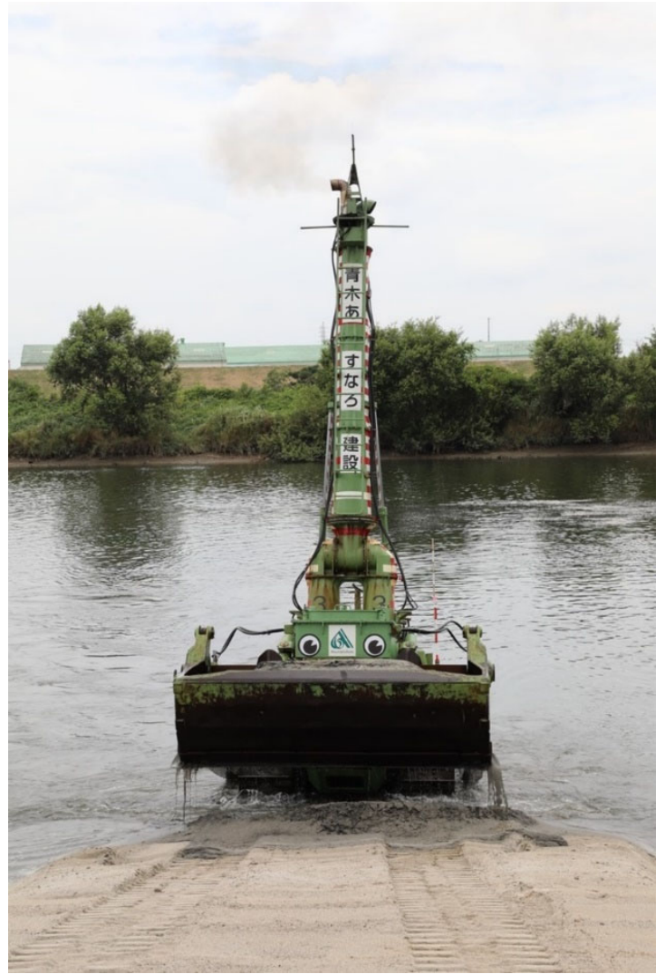
『たくさん土砂を取ってきたよ！』

水陸両用ブルドーザは、浅水域を作業領域とする無線操縦型の水中掘削機械です。現在稼働中のスイブルは、国内外で5台のみであり、当社でそのすべてを保有しております。東日本大震災で被災した宮城県名取川に架かる閑上大橋の災害復旧現場に投入、その様子を擬人化し、スイブルくんとして描いた絵本「のっぽのスイブル155」（作画：こもりまことさん）が出版されました。絵本を読んだ子供たちが、現場見学会等で本物のスイブルを見た時、「なぜ、目がついてないの？」といった質問をこれまで多々頂いておりました。そこで、スイブルを絵本と同じようにするべく、マグネットで作製し、現場見学会においては、目がついたスイブルが活躍しています。河床の土砂を掘削する姿は、現場見学会に来られた子供だけでなく大人からも「がんばれ！」「かわいい！」と好評をいただいております。