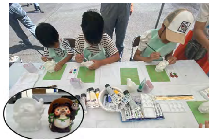
3D プリンターで作製した狸の色塗り