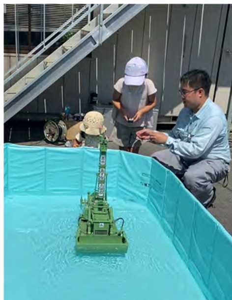
スイブル模型の無線操縦体験