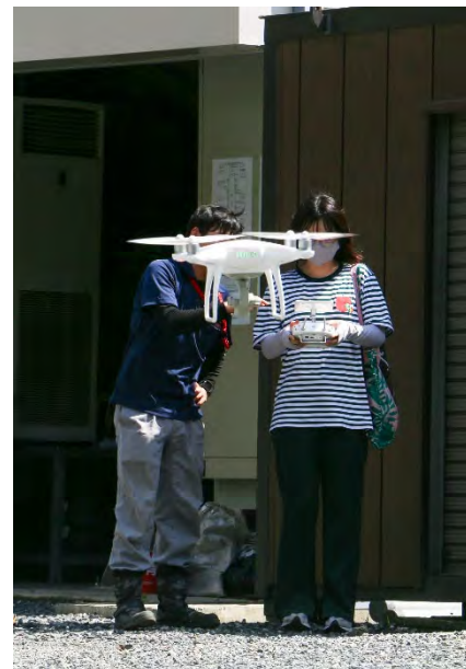
ドローン操縦体験