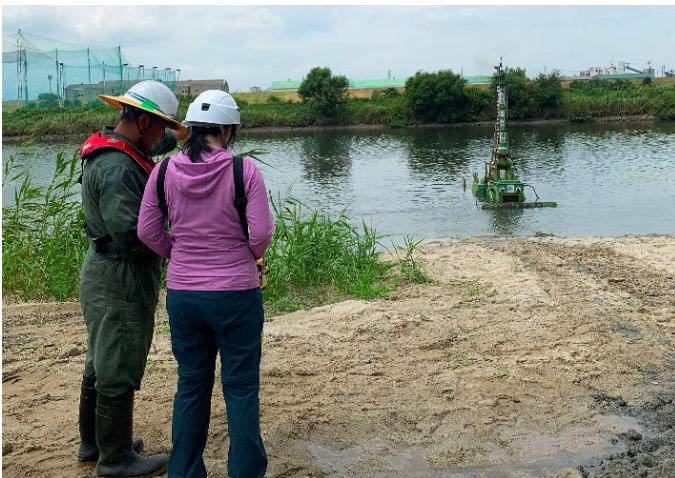
スイブル操縦体験

今後も長年の工事で蓄積した技術を継承、発展させ、水害対策や災害復旧などを通じて社会に貢献できるよう努めてまいります。