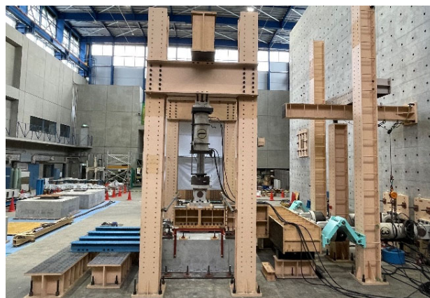
実験状況② せん断試験