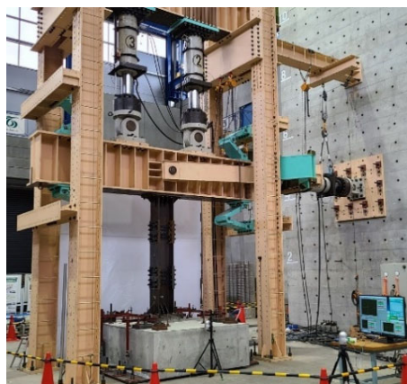
実験状況① 引張試験