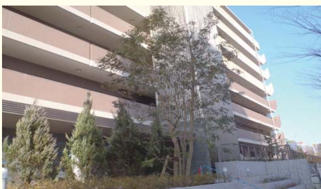
シンボルツリーが象徴的なエントランス前