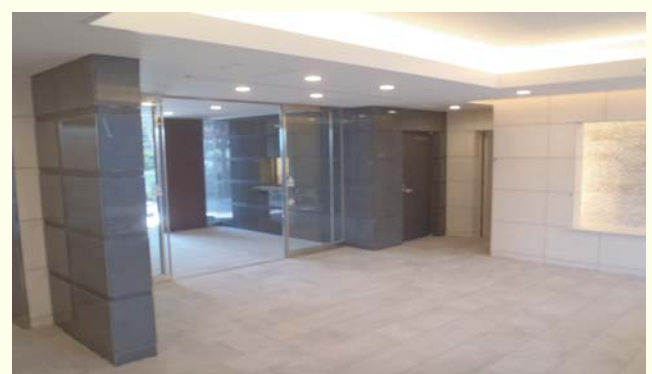
間接照明で効果的に演出されたエントランス