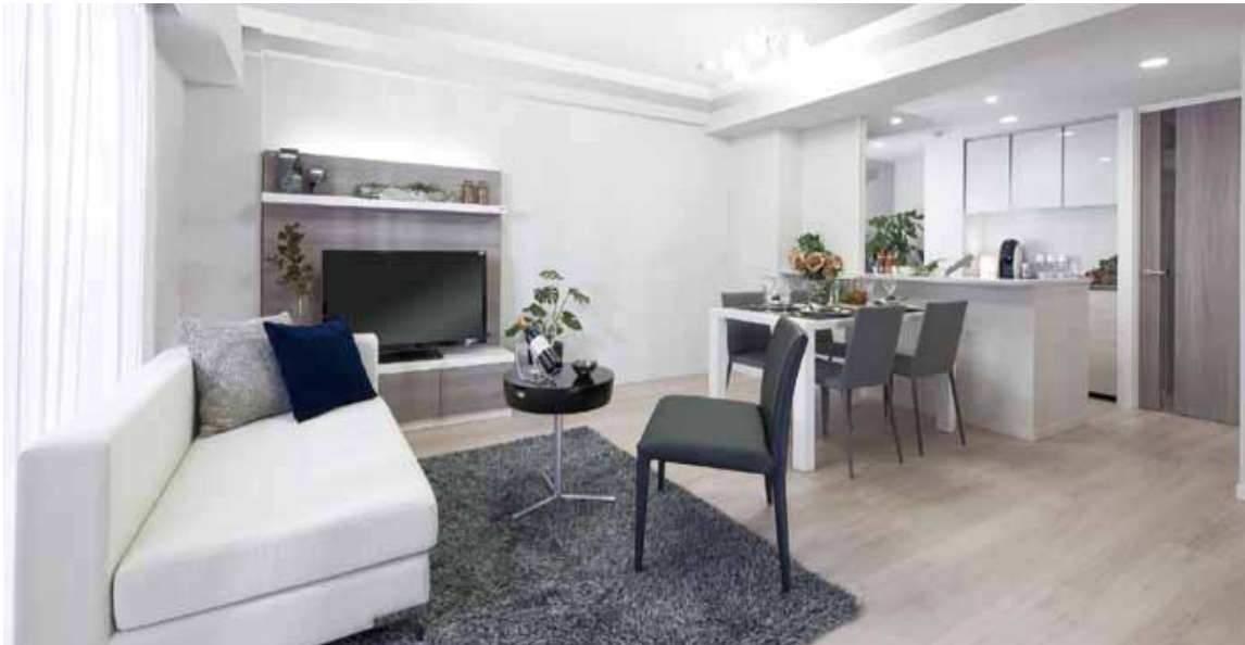
※掲載の写真はモデルルーム (Bタイプ) を撮影したもので一部CG加工を施しています。(2013年8月撮影)