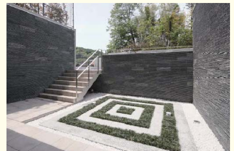
街並みに、調和し堂々とした佇まいを見せる「アビダス稲城駅前」 格調高いエントランスアプローチ。シンボルツリーが印象的です。敷地内にも緑の風景が楽しめる「エントランスガーデン」を設けました。