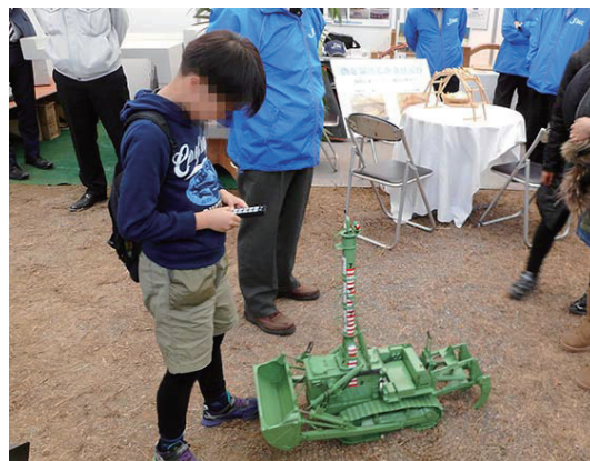
水陸両用ブルドーザのラジコン模型2