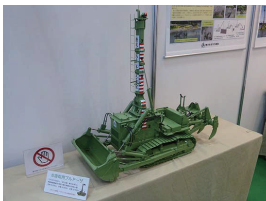
水陸両用ブルドーザのラジコン模型1

公式HP : http://www.kense-te.jp/observe/2018/07/09/2843/