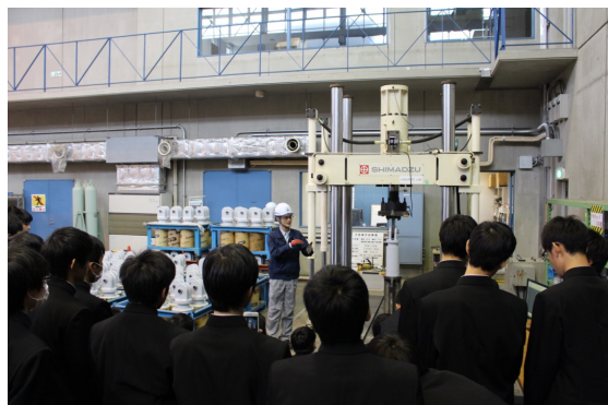
（建築用摩擦ダンパー載荷試験）