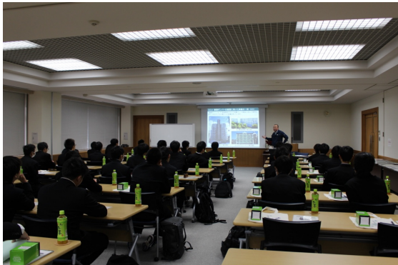
（技術研究所の役割や研究内容の説明）

文部科学省が、将来の国際的な科学技術関係人材を育成するため、先進的な理数教育を実施する高等学校等を「スーパーサイエンスハイスクール」として指定する制度。学習指導要領によらないカリキュラムの開発・実践や課題研究の推進、観察・実験等を通じた体験的・問題解決的な学習等を支援するもの。