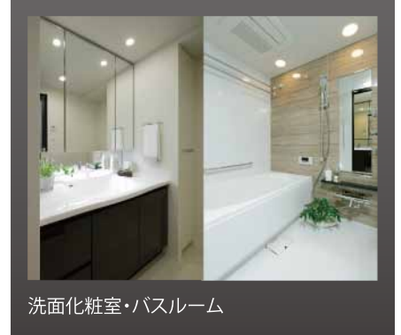
洗面化粧室・バスルーム